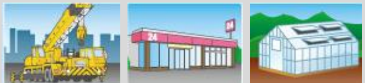
建設機械 コンビニ ビニールハウス