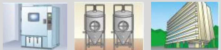
大形装置 酒造・醸造設備 ビル1棟