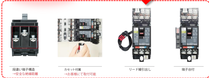
段違い端子構造 →安全な絶縁距離