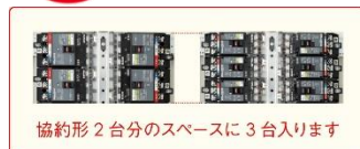
協約形2台分のスペースに3台入ります